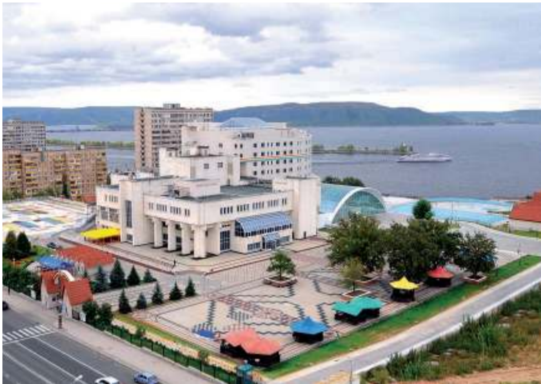
Точками притяжения для путешественников способны стать Дворец культуры «Тольяттиазот» и санаторий «Надежда»

– Самарская область обладает очень важными оздоровительными ресурсами. Регион находится в умеренной климатической зоне, на берегу крупнейшей реки Европейской части России. Объекты социально-культурного сектора Тольяттиазота обладают большими возможностями. Оснащенность современным оборудованием, сервис и живописное место расположения – все это, несомненно, будет способствовать увеличению туристического потока в регионе.