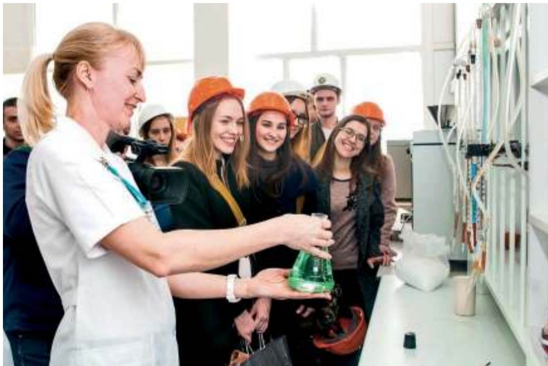
Тольяттиазот помогает подросткам найти своё место в мире профессий и формирует кадровый резерв