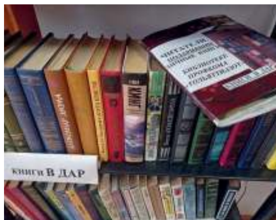
Имена коллег, подаривших книги заводской библиотеке, перечислены в специальной тетради